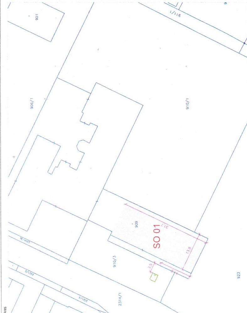
C1. Situční výkres širších vztahů