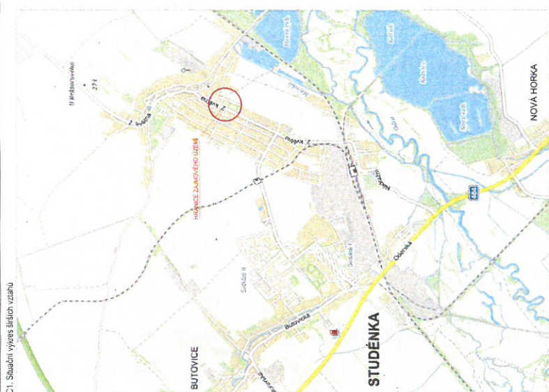
C1. Situční výkres širších vztahů - detail